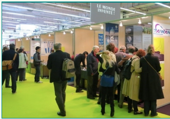
圖說：亞洲大學赴法國巴黎國際發明展參展，亞洲大學展區參觀人潮最多。

法國巴黎國際發明展，臺灣亞洲大學研發醫美新品等8件創意發明作品，與他國作品鬥豔。